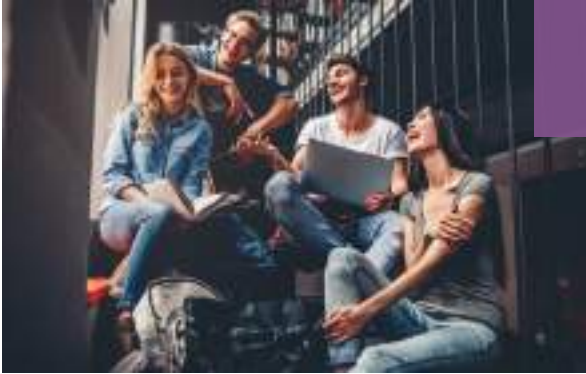
Internships and corporate experience