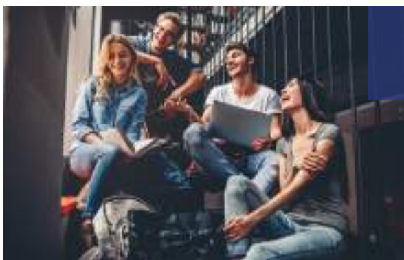
Tronc commun riche et diversifié

Nous vous accompagnons dans le choix de votre parcours