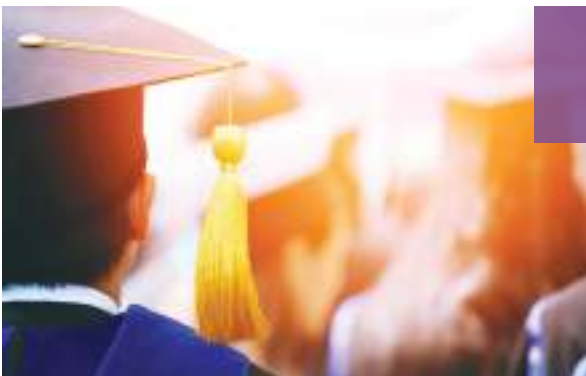
Multiple Professional Certifications