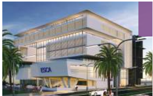
State-of-the-Art Campus Facilities