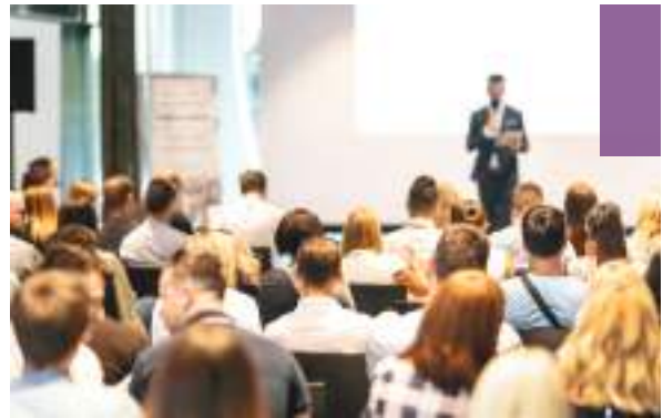
Unique Learning Experience